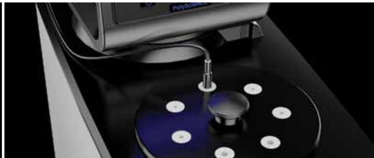
Accommodates thermometers and temperature sensors from 2 to 8 mm in diameter. See page 79 for available Sleeve Kits.